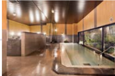
男女別人工温泉大浴場完備