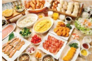
バイキング朝食無料サービス