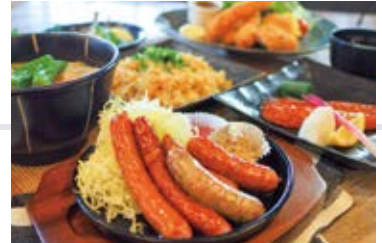
館内に居酒屋レストランあり

◎8/1~4、8/8~16、8/29、9月19日~22日は催事期間となります為、優待割引を通常料金から10%割引に変更させていただきます。