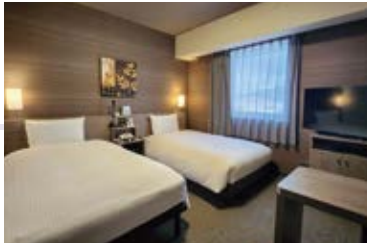
全室WOWOW無料視聴可能