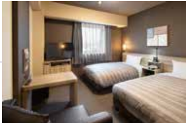
全室WOWOW無料視聴可能