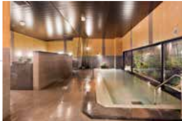
男女別人工温泉大浴場完備