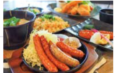
館内に居酒屋レストランあり

◎ 5/3~5/6は催事期間となります為、優待割引を通常料金から10%割引に変更させていただきます。