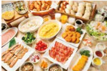
バイキング朝食無料サービス