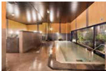
男女別人工温泉大浴場完備