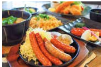
館内に居酒屋レストランあり

◎4/27~4/29、5/3~5/5の期間は、【通常料金から10%割引】とさせていただきます。 ご優待料金とは異なりますのでホテルまでお問い合わせくださいませ。