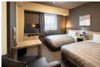
全室WOWOW無料視聴可能