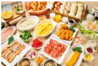
バイキング朝食無料サービス