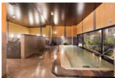
男女別人工温泉大浴場完備