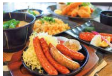
館内に居酒屋レストランあり