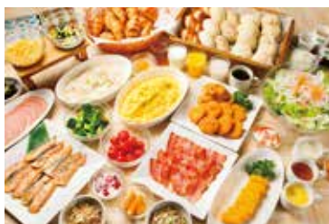
バイキング朝食無料サービス