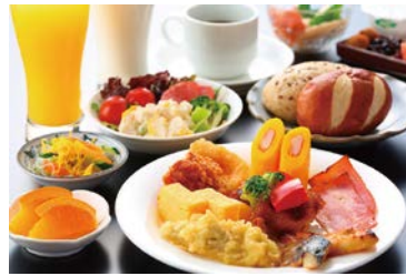
バイキング朝食無料サービス