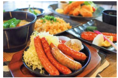
館内に居酒屋レストランあり

◎GW等の催事期間につきましては優待割引を通常料金から10%割引に変更となります ※料金をご予約時にご確認ください。