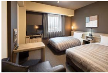
全室WOWOW無料視聴可能