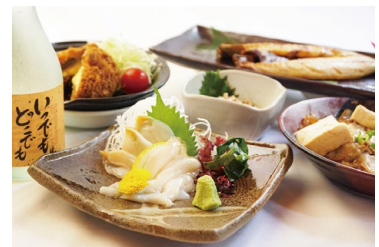
館内に居酒屋レストランあり