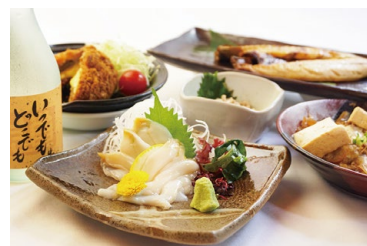
館内に居酒屋レストランあり