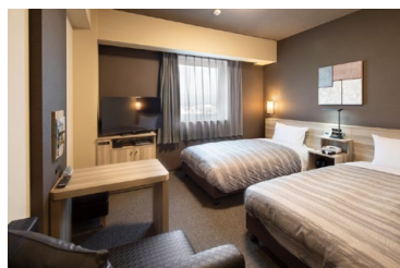
全室WOWOW無料視聴可能

※5/1日(土)~5/4(火)までの期間は通常料金から10%OFFでのご案内となります。