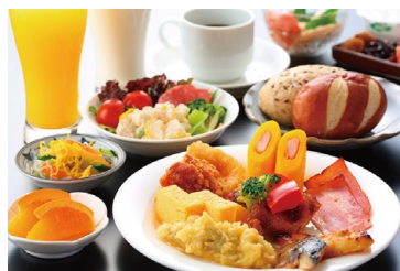
バイキング朝食無料サービス