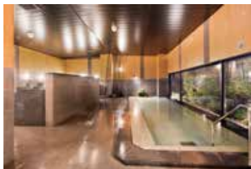
男女別人工温泉大浴場完備