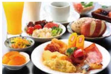
バイキング朝食無料サービス