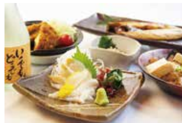
館内に居酒屋レストランあり