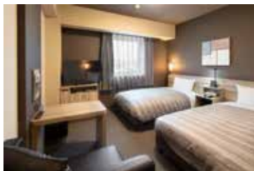
全室WOWOW無料視聴可能