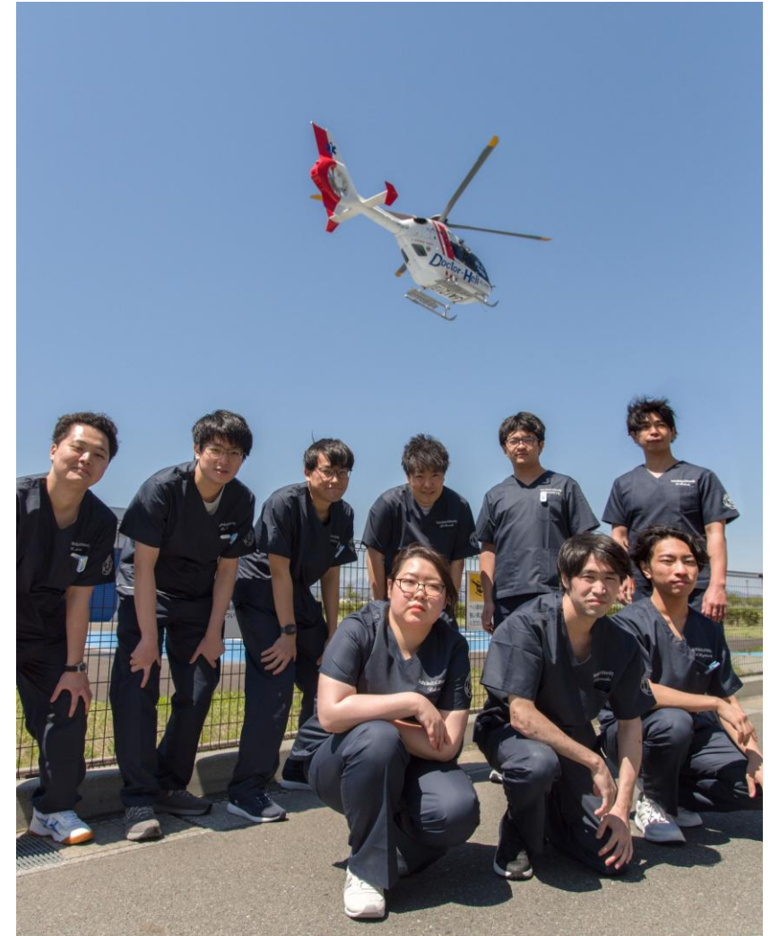
令和8年4月 CEセンターオリエンテーション