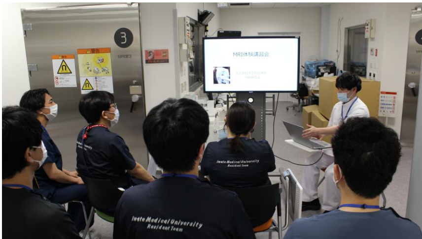
令和8年5月 MRI体験講習会