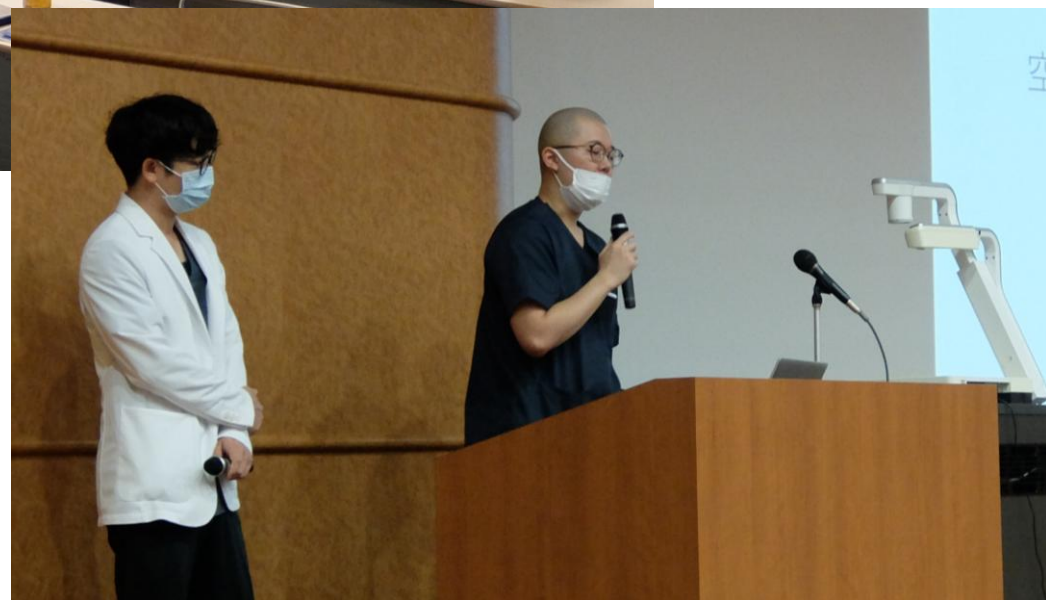
令和6年10月 医学部学生との座談会（キャリア教育） ※臨床研修について学生の質問に答えました