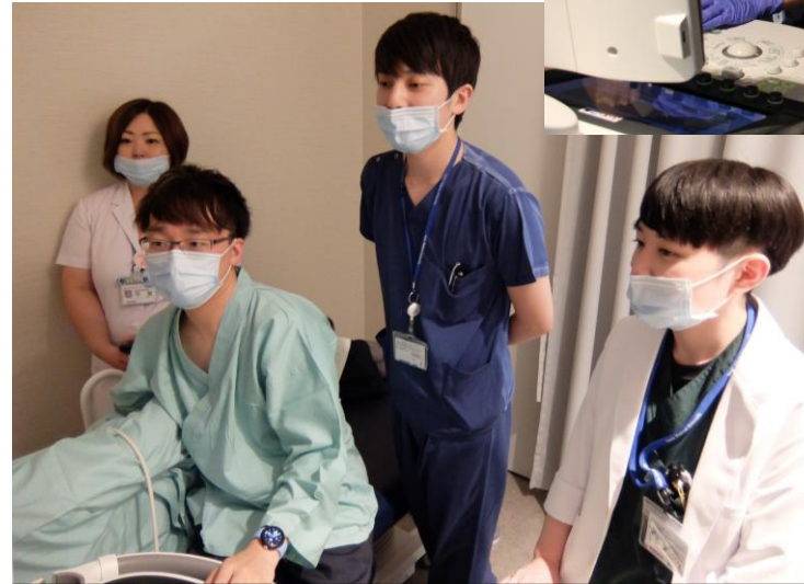
エコーセミナー for レジデント 「エコレジ」 (複数診療科・随時開催)