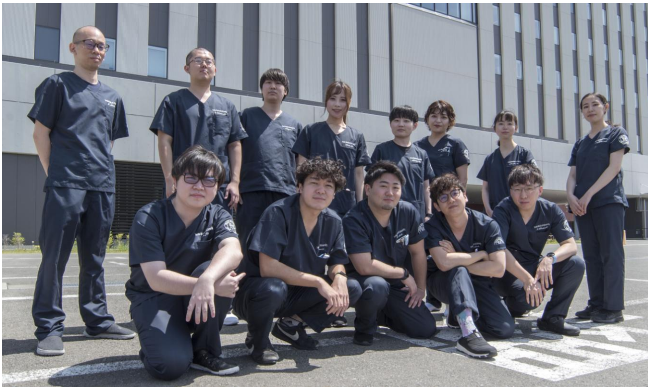
令和6年4月 臨床研修開始