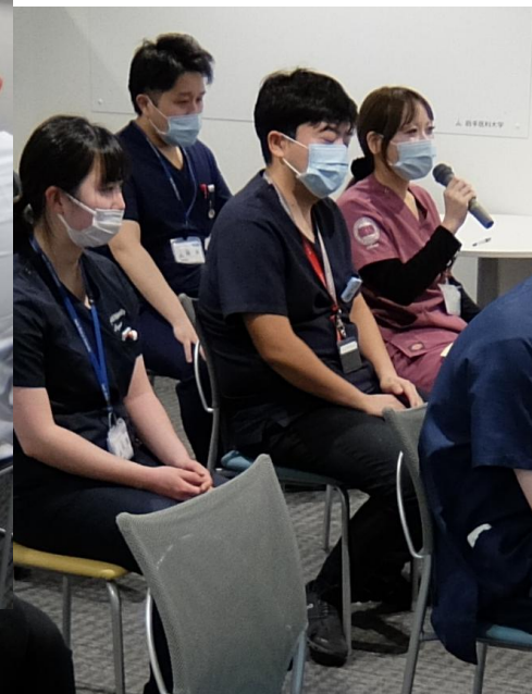
令和7年1月 臨床研修医OSCE（1年次・2年次）