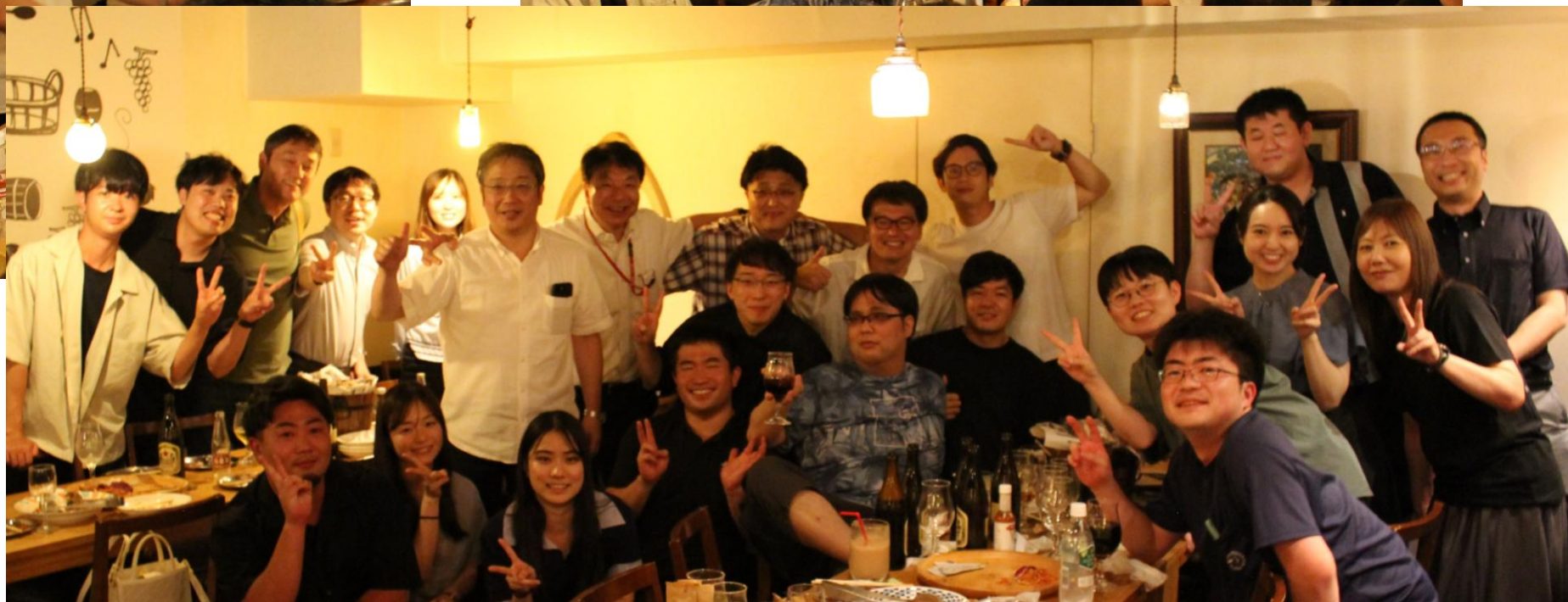
令和7年8月 臨床研修センター懇親会（1年次・2年次）