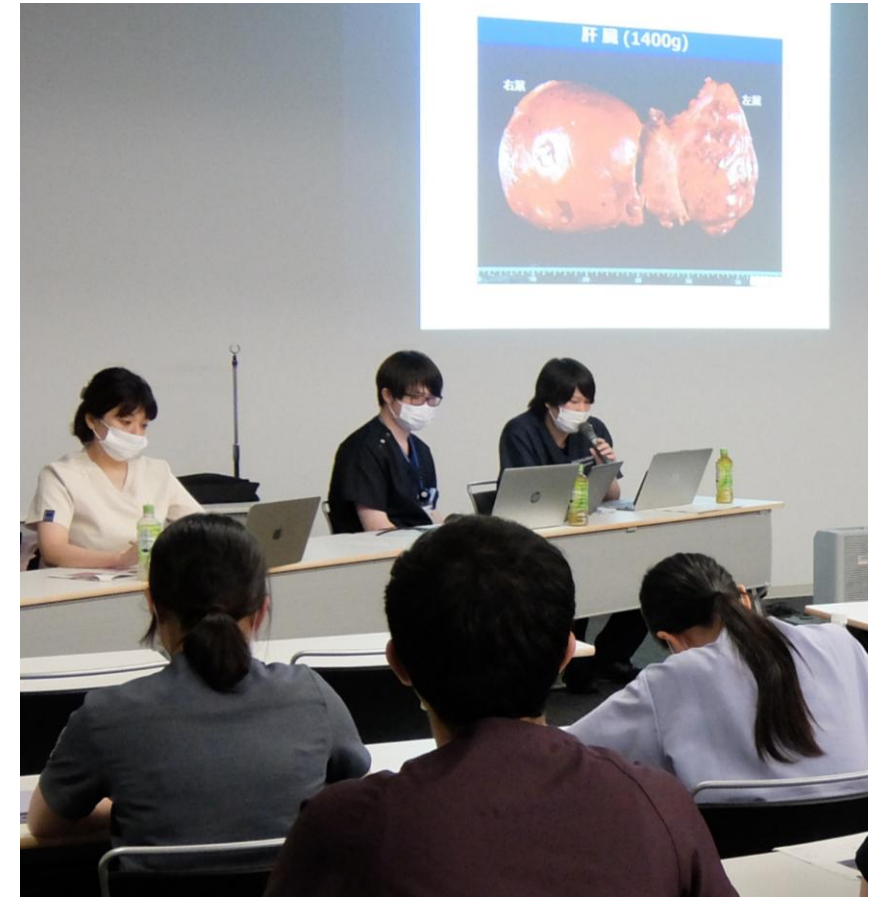
臨床病理症例検討会CPC （1年次・2年次） ※病理研修後随時開催