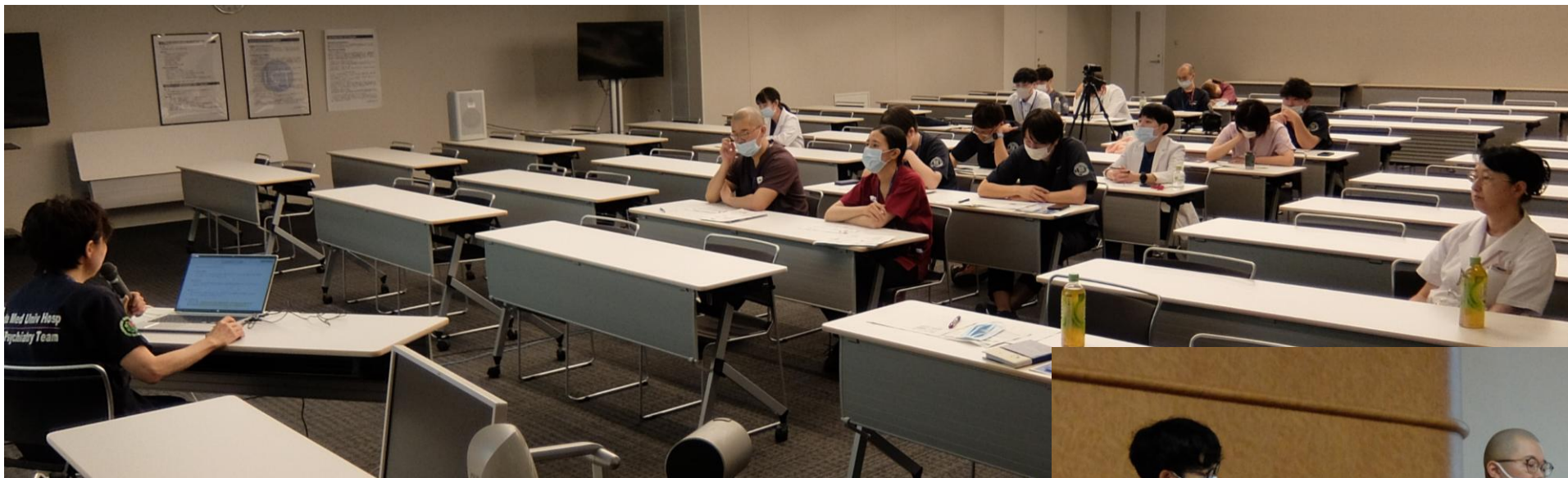
令和6年10月 子ども虐待講習会 死亡診断書死体検案書の講義（1年次） ※岩手県内臨床研修病院と共にZoom開催