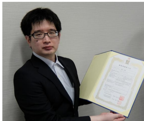
令和8年3月 臨床研修修了