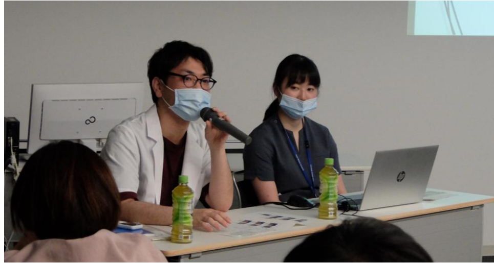
毎月第4水曜日 症例発表会 GRAND ROUNDとコアレクチャー（1年次・2年次）